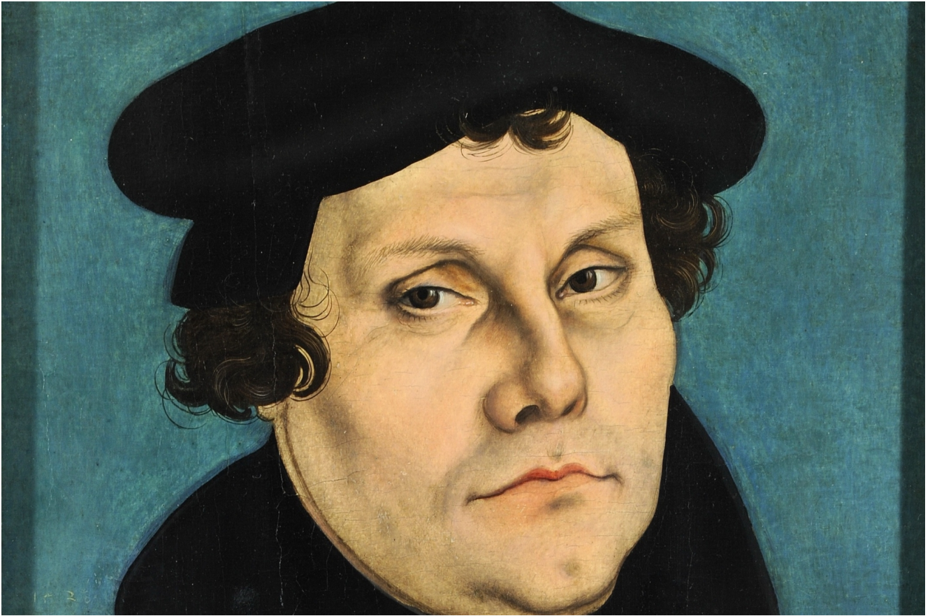
ritratto di Martin Lutero di Lucas Cranach (1529)