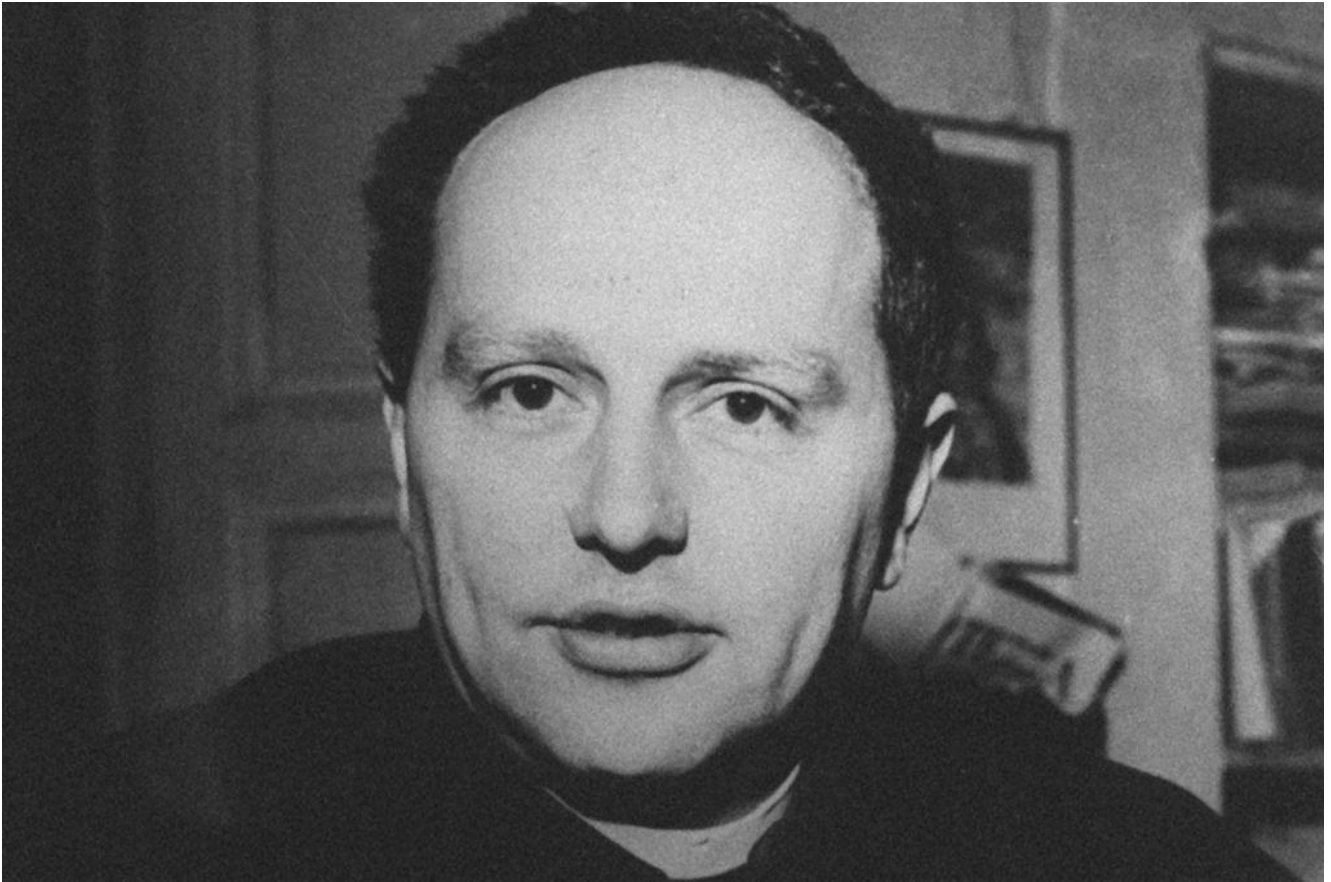
don Lorenzo Milani

«No, non direi che la visita del Papa possa essere considerata un risarcimento. Tutti abbiamo sofferto e pagato qualcosa. Anche il Papa ne ha avuto. E quello che si è pagato non ce lo può dare il Papa, non ce lo dà la Chiesa, ma Dio». Il cardinale Gualtiero Bassetti, presidente della Cei , commenta così la visita di papa Francesco a Barbiana. Un gesto che «ci dice semplicemente che quest'uomo, questo sacerdote ha camminato sulla strada giusta, è stato un pastore fedele. E la Chiesa oggi ne riconosce la profezia».