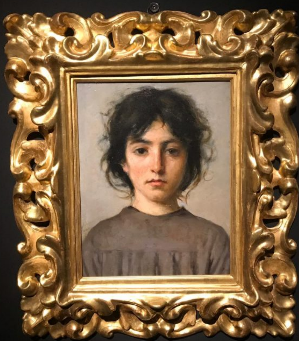
SIXTY (Museum) L'ad The 1893 plus L'ad