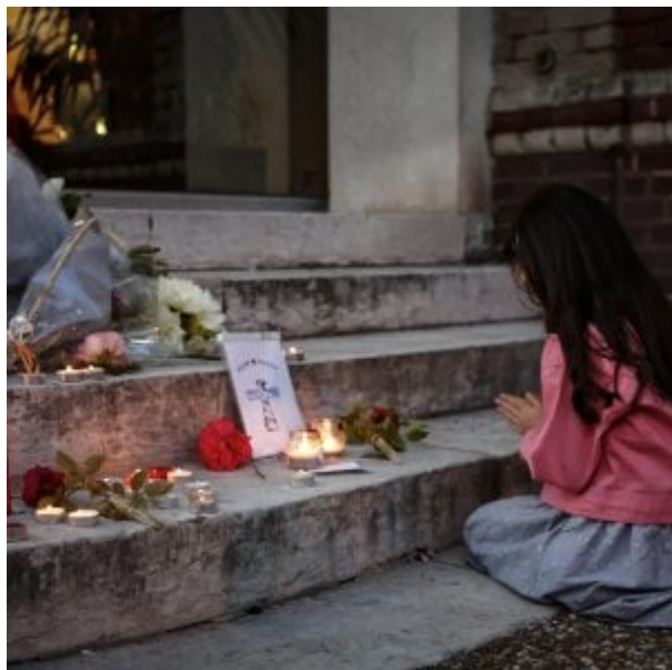
Saint-Etienne-Du-Rouvray, fiori e preghiere in memoria di padre Hamel

L'Islam ci ha riuniti in una stessa casa, una nazione. Che lo vogliamo o no, apparteniamo tutti a quello spirito superiore che celebra la pace e la fratellanza. Nel nome "Islam" è contenuta la radice della parola "pace". Ma ecco che da qualche tempo la nozione di pace è tradita, lacerata e calpestata da individui che pretendono di appartenere a questa nostra casa, ma hanno deciso di ricostruirla su basi di esclusione e fanatismo. Per questo si danno all'assassinio di innocenti. Un'aberrazione, una crudeltà che nessuna religione permette.